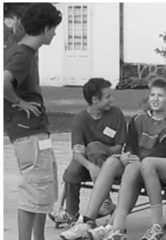
Táborszervezők a közelmúltból

A nyitótábor pályázata, annak témája és a nyertes csapat kiléte titkos mindaddig, amíg a szervezők fel nem veszik a kapcsolatot a leendő hetedikesekkel.